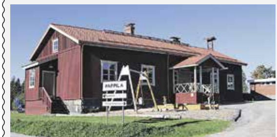
Sanajumalanpalvelus Pappilan pihapiirissä 25.5. klo 12, osoite Pappilantie 65. Sateen sattuessa Vanhassa kirkossa.

Jumalanpalveluksen jälkeen on väentuvassa tarjolla kirkkokahvit ja kodassa nokipannukahvit ja vahtokarkkien paistamista.