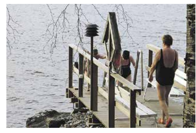
Veden lämpötilalla ei ole mitään väliä Pihlajaniemessä naisten vuorolla saunoville. Talvella pulahdetaan avantoon, kesällä päästään nauttimaan pitkistä uintiretkistä.

KERRAN kuukaudessa naisten saunaan kuuluvat seurakunnan työntekijän tai vapaaehtoisen pitämä hartaushetki sekä tarjoilu. Pikku hiljaa naiset siirtyvät takkatuvan puolelle. Märät hiukset, villapaidat ja villasukat kuuluvat tunnelmaan. Joskus saunan jälkeen on laitettu pöytä korkeaksi myös nyyttärihengessä. Hartaushetken ja iltapalan jälkeen juttu jatkuu vielä pihalla. Ei maltraisi millään lähtä, mutta ensi viikolla pala-