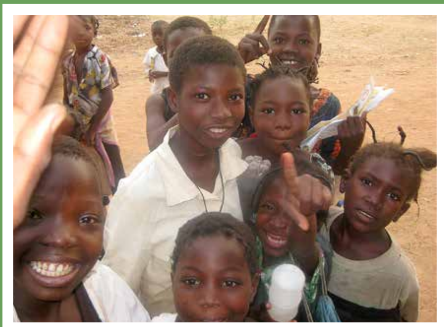
Lapset matkalla kouluun Burgina Fasossa.