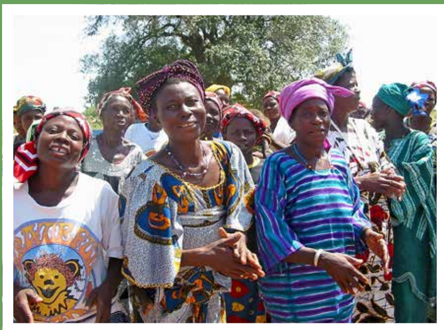
Burgina Fasossa asuvat naiset toivottavat tervetulleeksi kylään laulamalla afrikkalaiseen tapaan.