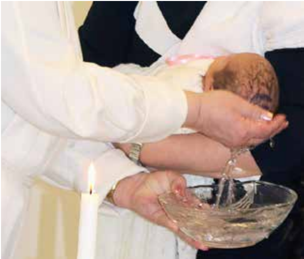
Kaste toimitetaan yleensä noin kahden kuukauden sisällä lapsen syntymästä. Pirkkalassa kastetaan vuosittain liki 200 henkilöä.

KIRKOLLISKOKOUS päätti marraskuussa, että ensi vuoden alusta kastettavalla tulee olla aiemman kahden kummin sijaan ainakin yksi kummi, joka on konfirmoitu evankelis-luterilaisen kirkon jäsen. Kummien muuttuneella vähimmäismäärällä yritetään helpottaa kastejärjestelyjä perheissä ja madaltaa kynnystä kastaa lapsi tai aikuinen kirkon jäseneksi. Päätös palvelee erityisesti niitä perheitä, joissa kirkkoon kuuluvien kummien löytäminen on vaikeaa.