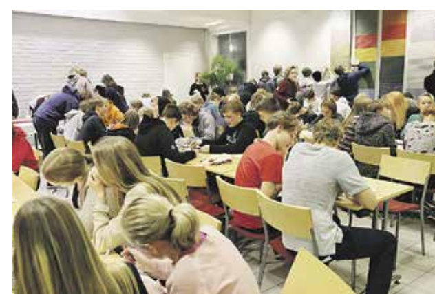
Kuluneen vuoden rippikoululaiset ilmoittautuivat viime vuoden joulukuussa perinteiseen tapaan Kirkkoveräjän seurakuntatalossa.

– Rippikoulu luo uusia kaaverisuhteita ja saa ajattelemaan elämästä entistä syvem-