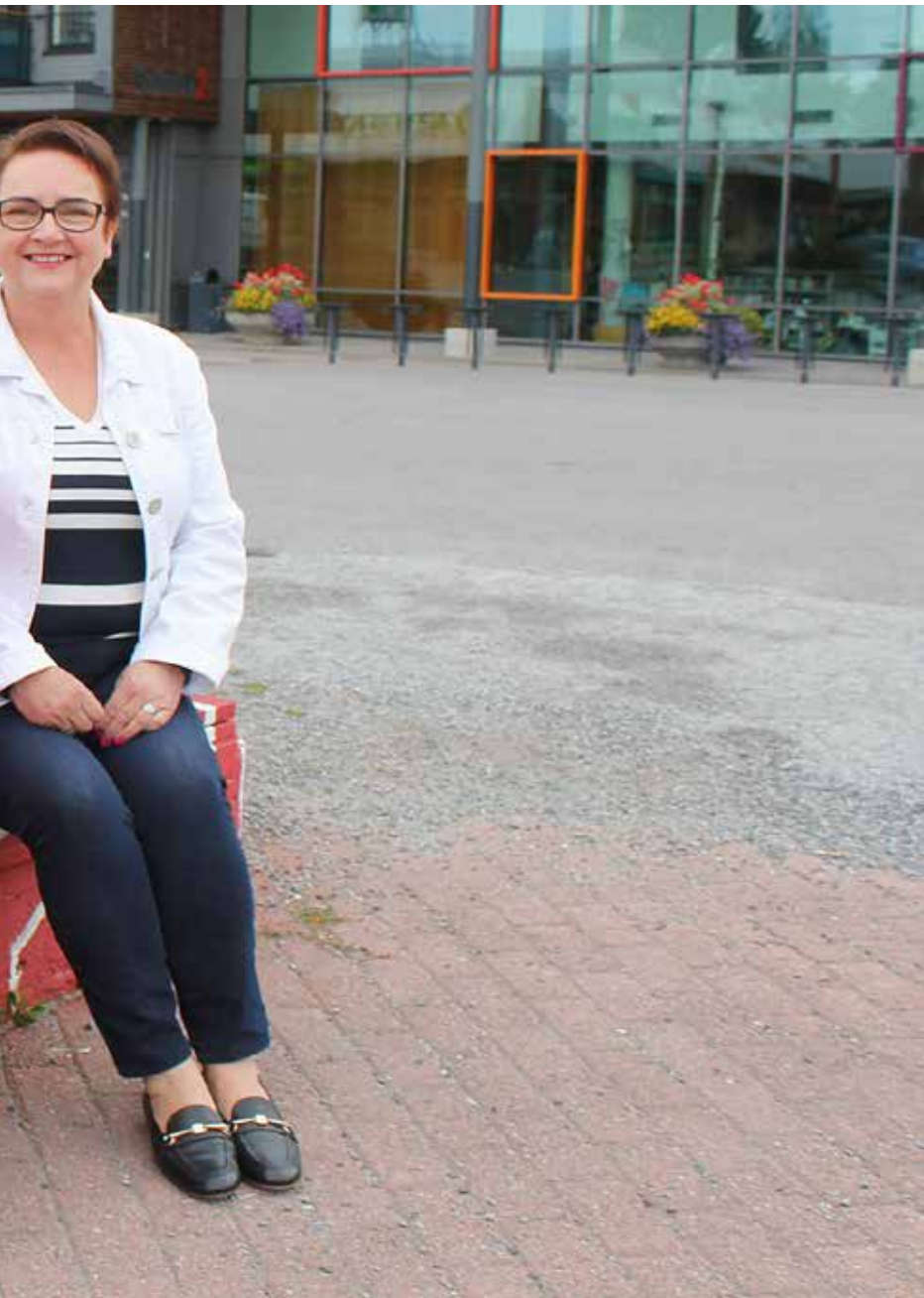
Teksti ja kuva: Vesa Keinonen