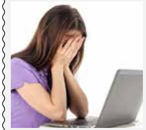
Älä jää murheidesi kanssa yksin. Jos kaipaat kuuntelijaa, voit esimerkiksi soittaa kirkon keskusteluapuun.

Suomenkielinen numero on 040 0221 180 ja ruotsinkielinen 040 0221 190. Operaattori veloittaa puhelusta liittymäsovit- muksen mukaisen hinnan.