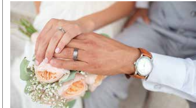
Häätapahtuma mahdollistaa halvan ja helpon hääjuhlan. Erityisiä hääasuja tai kimppeä ei tarvitse hankkia, jos ei halua. Hääkim- pun voi lainata kirkosta.