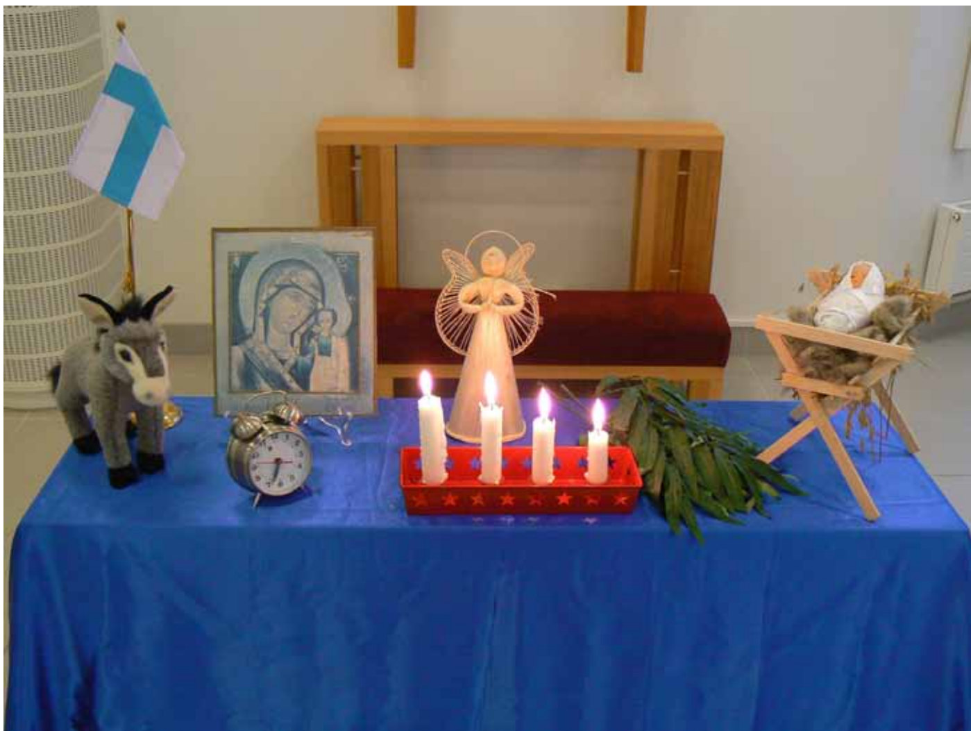
VeisuuAstia 2:n virsikattaus, jossa oikealla jouluseimi virteen 32. Armas Maasalon virsi on lasten jouluvirsi, jonka juonnossa opitaan seimi -sanon merkitys. Virsi 32 voidaan lisätä VeisuuAstia 2:n valikoimaan haluttaessa.