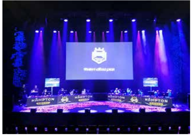
Verkatehtaan päälavalla oli isojen turnauksien tuntu.