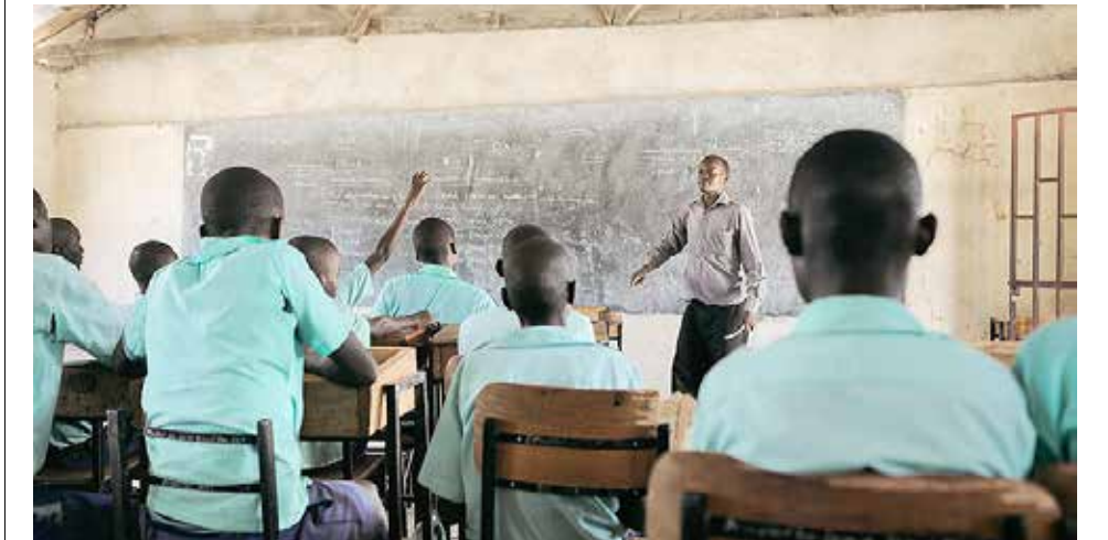
Kirkon Ulkomaanapu tukee lasten ja nuorten koulutusta Kenian Turkanassa muun muassa oppimateriaaleilla, opettajien koulutuksella ja kehittämällä vanhempia lähettämään lapsensa kouluun.

Yhteisvastuun apu on mahdollisimman konkreettista – ihmisiä autetaan itse itseään auttamaan. Avun saaminen ei katso syntyperää, uskontoa tai poliittista vakaumusta. Jo 70 vuoden aikana sadattuhannet ihmiset Suomessa ja kehitysmaissa ovat saaneet apua Yhteisvastuulta.